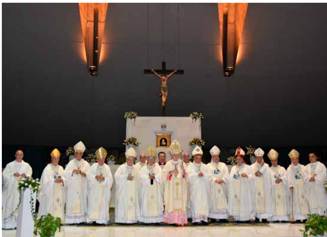
Il Cardinale Pietro Parolin con l'Arcivescovo e i Vescovi concelebranti.