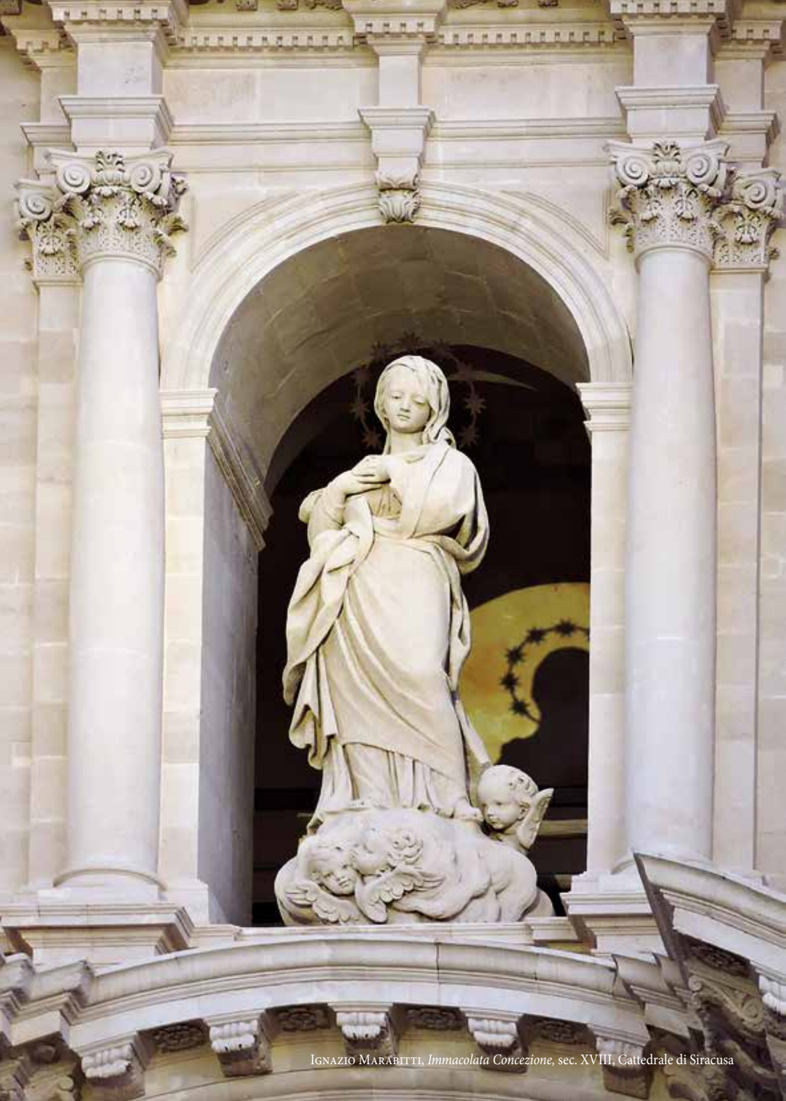
IGNAZIO MARABITTI, Immacolata Concezione , sec. XVIII, Cattedrale di Siracusa