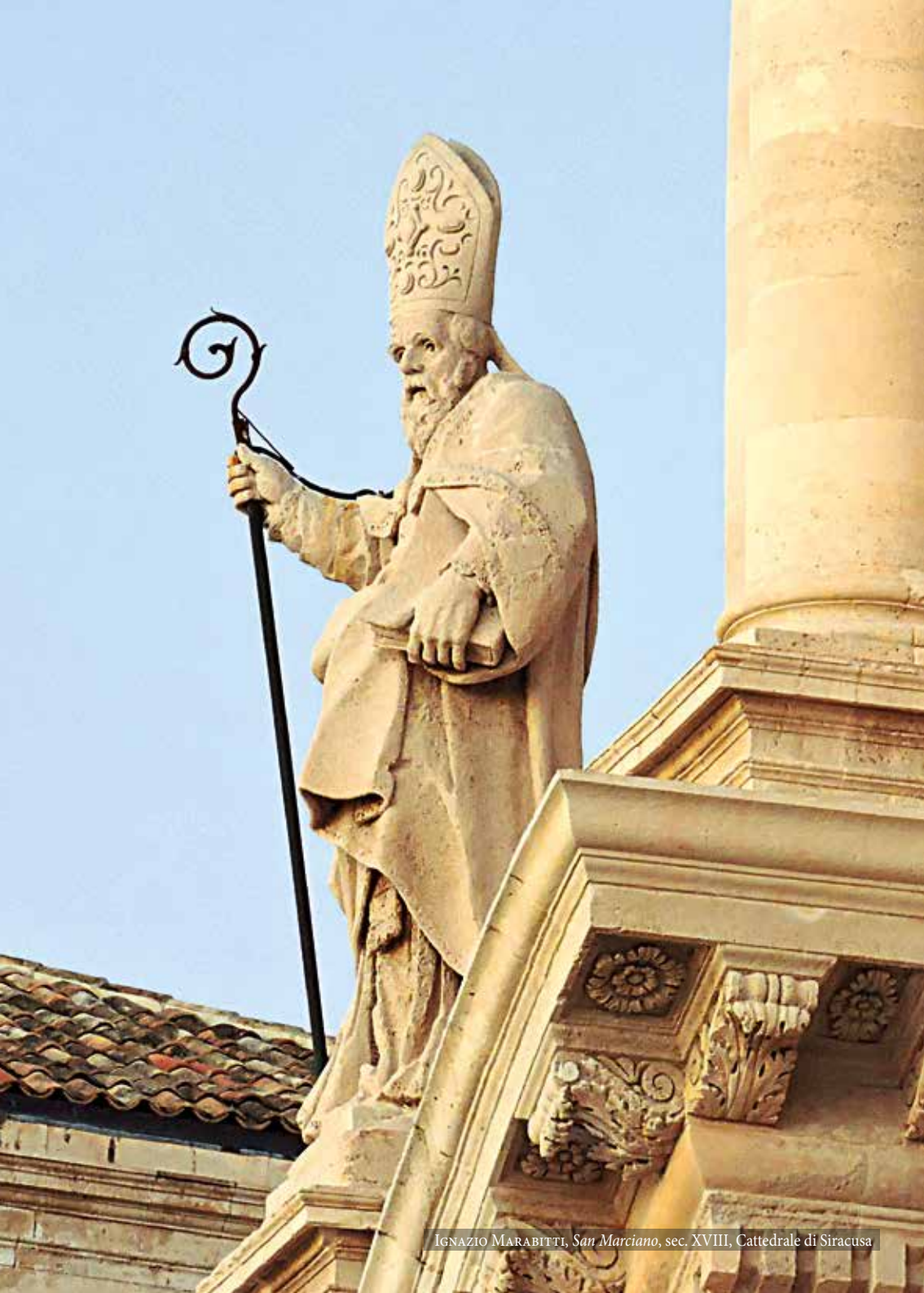
IGNAZIO MARABITTI, San Marciano , sec. XVIII, Cattedrale di Siracusa