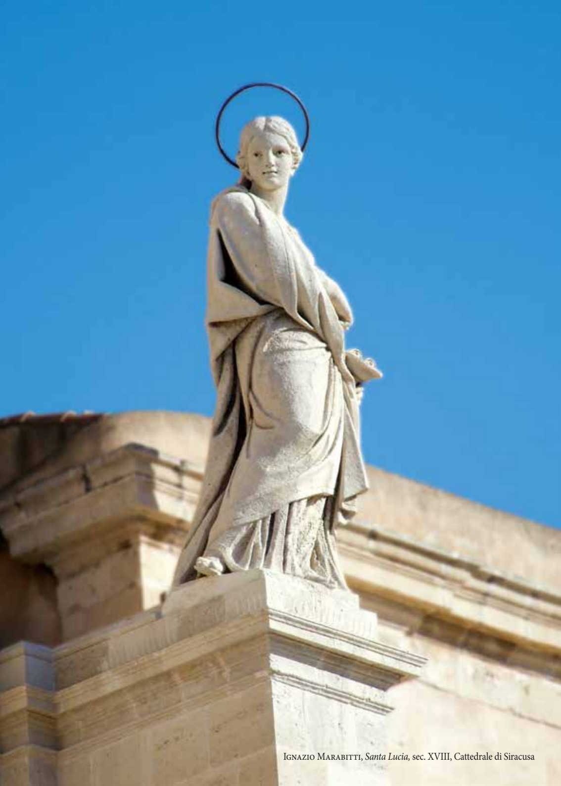
IGNAZIO MARABITTI, Santa Lucia , sec. XVIII, Cattedrale di Siracusa