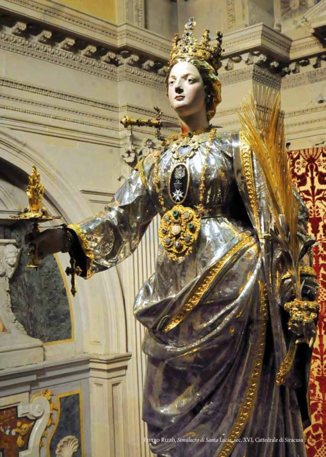
PIETRO RIZZO, Simulacro di Santa Lucia , sec. XVI, Cattedrale di Siracusa