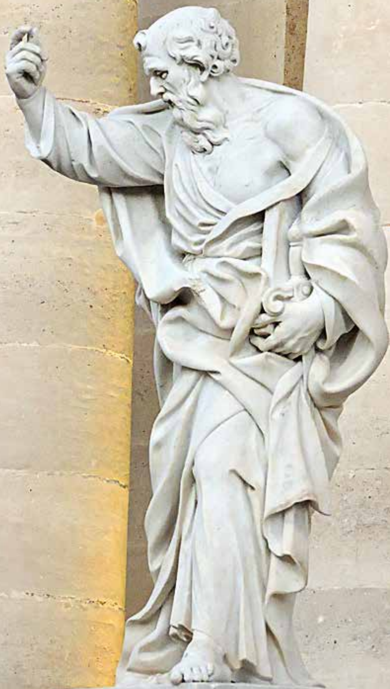
IGNAZIO MARABITTI, San Paolo , sec. XVIII, Cattedrale di Siracusa