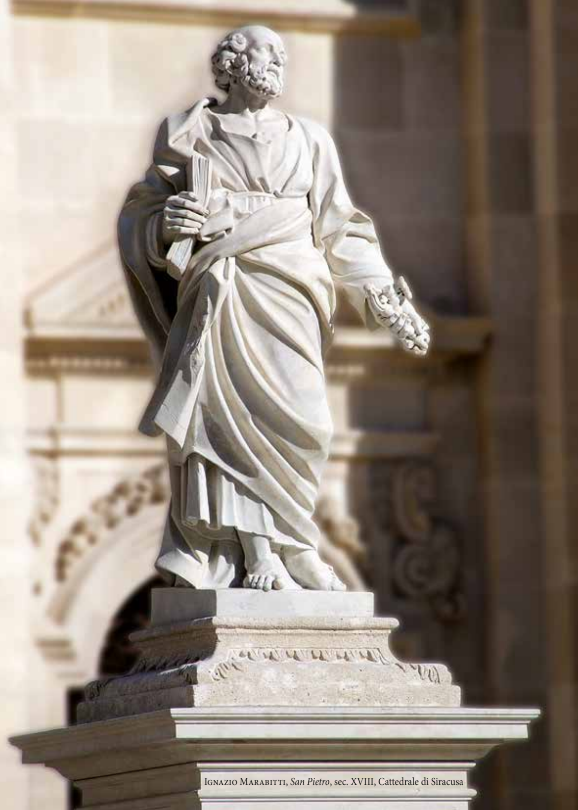
IGNAZIO MARABITTI, San Pietro , sec. XVIII, Cattedrale di Siracusa